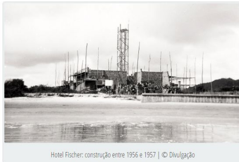
Hotel Fischer: construção entre 1956 e 1957

O Hotel Fischer foi inaugurado no dia 15 de dezembro de 1957, na Barra Sul de Balneário Camboriú, e revelou-se uma importante contribuição para o desenvolvimento da cidade, sendo um marco da arquitetura, da hotelaria e do turismo no Brasil. Ao longo dos seus 52 anos de atividade, influenciou o desenvolvimento urbano e cultural da cidade. Em 2009, o Hotel Fischer fechou suas portas, e foi demolido em 2012.