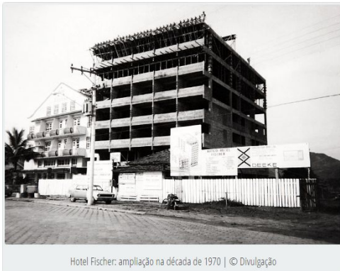
Hotel Fischer: ampliação na década de 1970